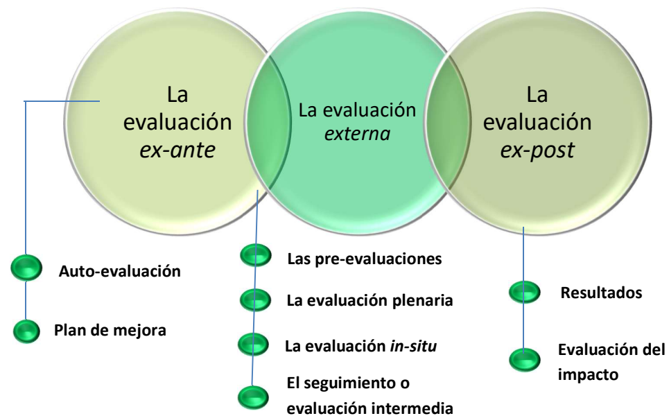
Figura (2.2) Etapas del proceso de evaluación del PNPC